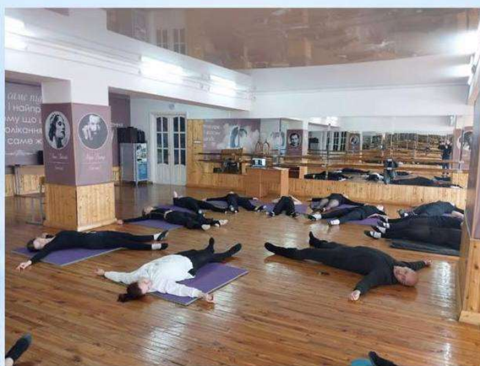
Навчально-методичний практикум «Танцювально-рухова практика: виклики сучасності» (2024)