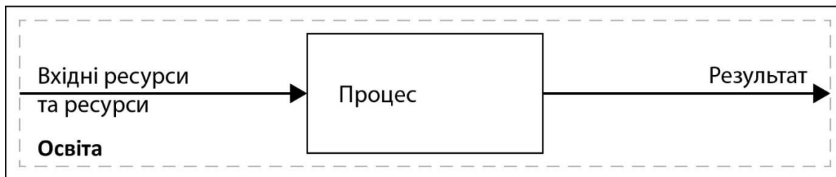
Рисунок 1. Модель «Вхідні дані та ресурси – Процес – Результат» для розбудови інклюзивного освітнього середовища ЗВО

Ця модель складається з трьох основних елементів: