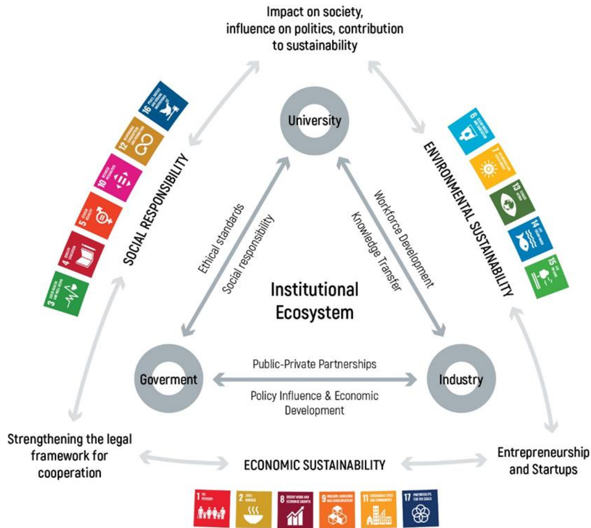
Модель потрійної спіралі