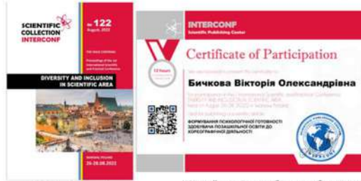
Публікація статті у польському виданні

Метою статті полягало з'ясування ролі педагога-хореографа (керівника хореографічного колективу, туртка) у формуванні психологічної готовності здобувача позашкільної освіти до хореографічної діяльності.