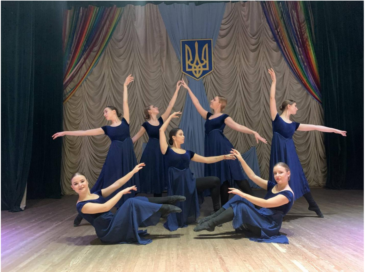
Рис. 3. 2. Фрагмент хореографічної композиції...

(нумерація означає: рисунок 2 третього розділу).