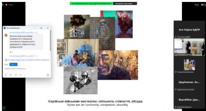
Сирійське військово мистецтво: спільнота, співчуття, абсурд Syrian war art: community, compassion, absurdity