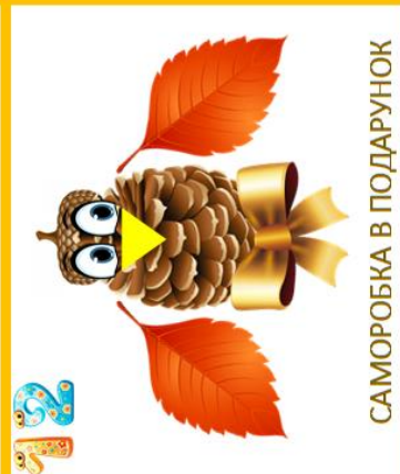
САМОРОБКА В ПОДАРУНОК