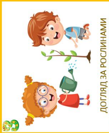
ДОГЛЯД ЗА РОСЛИНАМИ