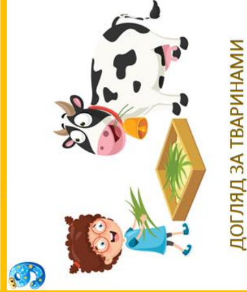
ДОГЛЯД ЗА ТВАРИНАМИ